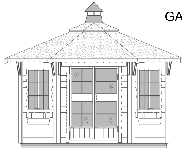
ARCTIC FINLAND HOUSE VICTORIA HUVIMAJA 6.5 m2